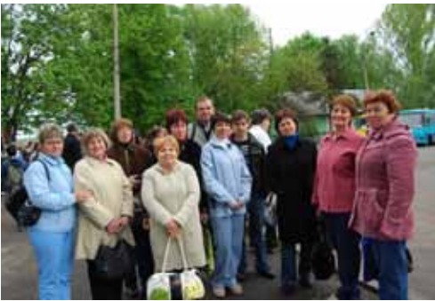
Умань, 2011 р.