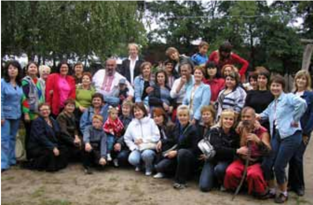
Козацький стан, 2006 р.