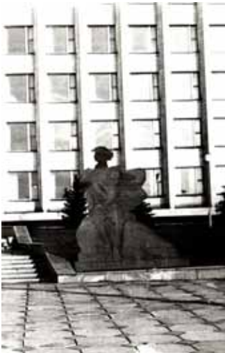
Макет пам'ятника на фоні будівлі (1978 р., скульптор В. К. Дубінін)

А тепер маємо чудову нагоду ознайомитися з частиною документальних історичних джерел, у яких зафіксовані окремі моменти зародження, функціонування і розвитку ОУНБ імені О. М. Горького в хронологічних рамках початку та середини ХХ століття, розширити свої пізнання її біографії, змінити усталені стереотипи і погляди на соціокультурне значення закладу в різні часи перемін у суспільстві, оцінити високий професіоналізм кожного співробітника, створити картину діалектичного зв'язку поколінь. Крім того, ці документи повинні стати для нас об'єктом більш глибокого і всебічного вивчення, старанного аналізу знову отриманої інформації, її ідентифікації та систематизації з метою достовірної реконструкції розвитку бібліотеки періоду 1905–1941 рр.