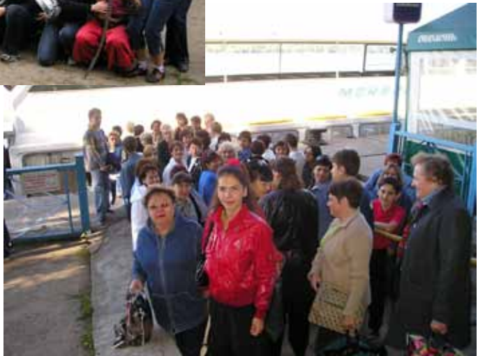
Прогулянка катером, 2007 р.