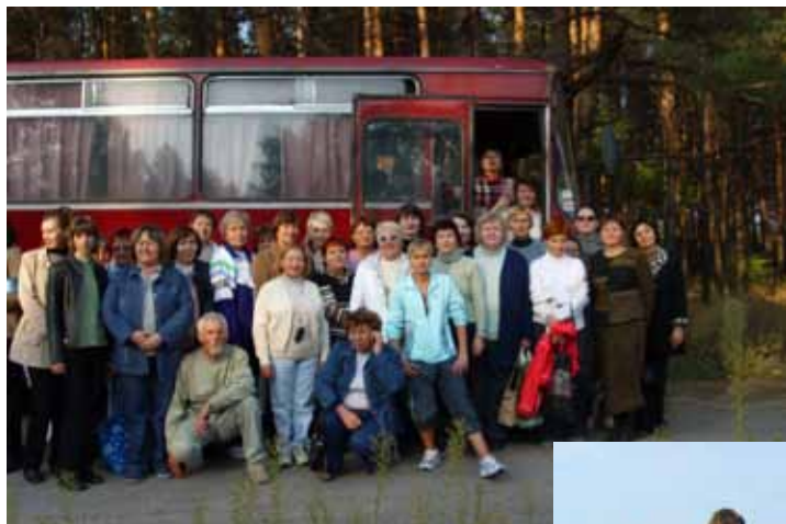
Поїздка до Ново- московська, 2008 р.