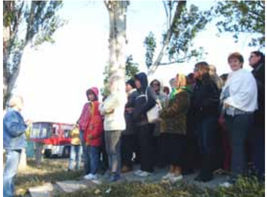
Скіфський стан, 2011 р.