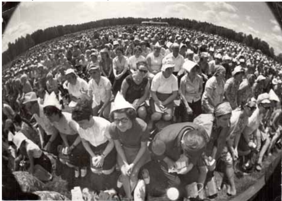
Коллектив на VI Всесоюзном Пушкинском празднике (1972 год)