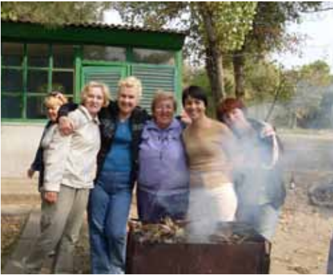
На базі відпочинку «Вікторія», 2009 р.