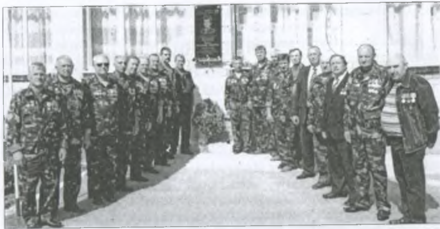
Воїни-інтернаціоналісти біля меморіальної дошки Володимиру Вороні

війни... Чи думав він тоді, зовсім молодий хлопчина, який тільки-но починав жити, що йому доведеться ховати серце і тіло від злих і холодних куль? А ще гірше – чи думав він колись, що йому доведеться стріляти у ворога, щоб той не вбив його?