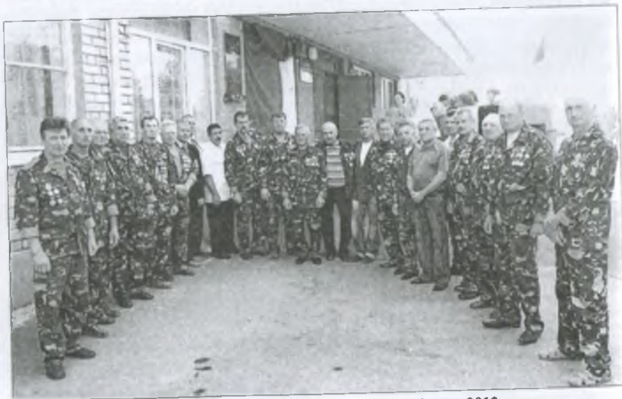
Воїни-інтернаціоналісти у колегіумі «Лідер». 2012 р.

дальністю і старанням – спеціально дістав плащ-палатку, військові чоботи, пілотку. У нього ця роль вдалася майстерно й реалістично.