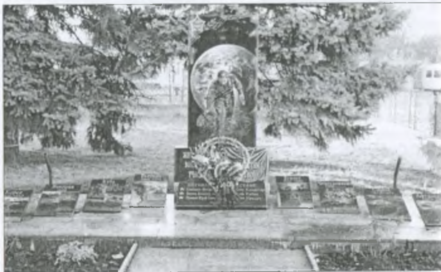
Пам'ятний знак воїнам-інтернаціоналістам в м. Гуляйполі

11 грудня 2009 року на центральному меморіалі Слави відбулося офіційне відкриття Пам'ятного знака воїнам-інтернаціоналістам Гуляйпільського району, а у КСК «Сучасник» того дня пройшов концерт, присвячений 20-й річниці виведення радянських військ із території Афганістану.