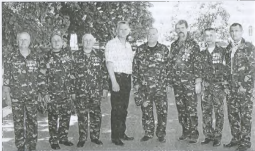
Група воїнів-інтернаціоналістів. Фото на згадку. 8.05. 2013 р.