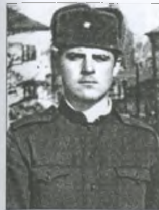
Микола Миколайович Азаров на службі у Радянській Армії

Після чехословацьких подій займалися будівництвом казарм для солдат та гуртожитків для офіцерів.