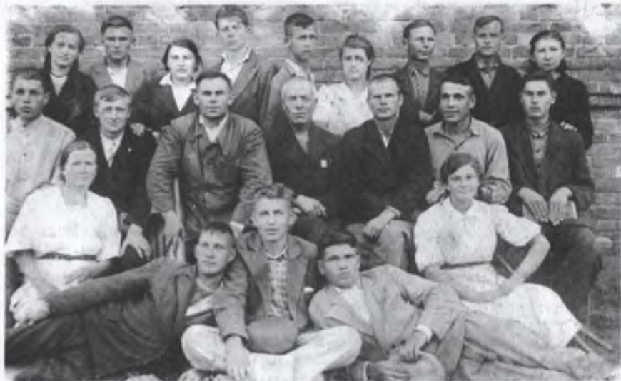
Члени артїлі ім. Шевченка

Важливе значення у забезпеченні доброго врожаю мали і правильний набір високоврожайних сортів та старанний догляд за овочевими культурами.