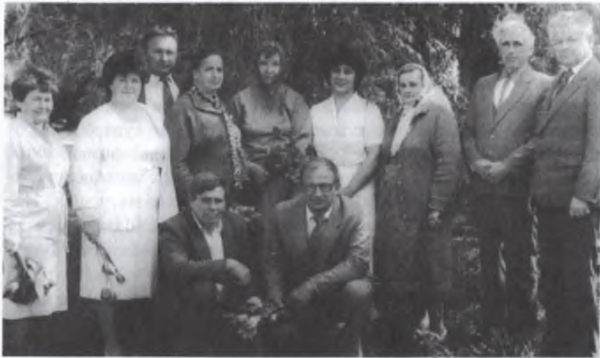
Адміністративний персонал колективного сільськогосподарського підприємства «Батьківщина» 1 травня 1990 року

іншими. Бо від кількості молока значною мірою залежить і кінцевий результат – одержання здорових нетелів.