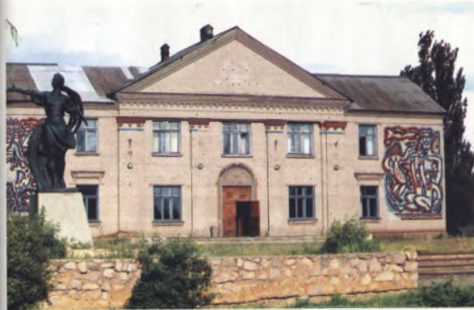
Малинівський Будинок культури