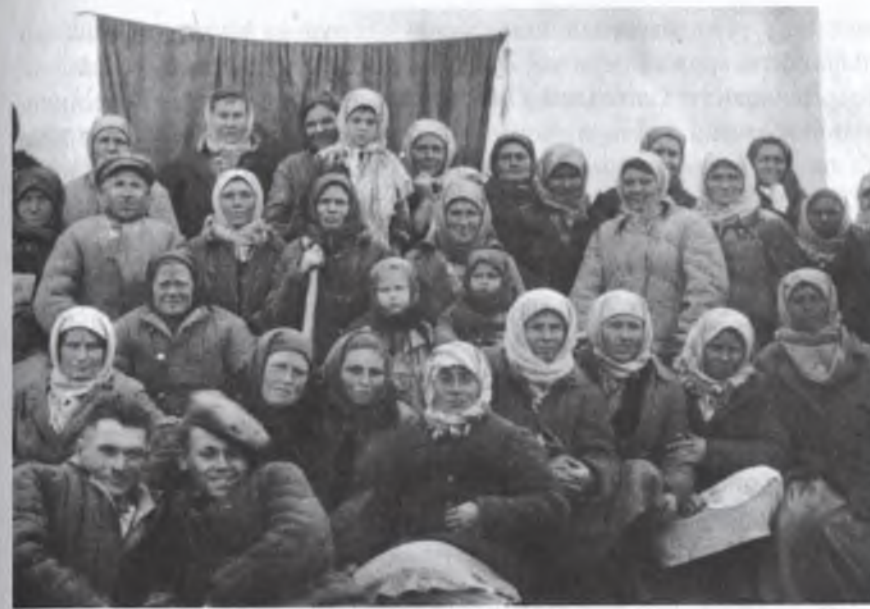
Група колгоспників артїлі «Зоря комунізму», що прийшли на загальні збори

У 1946 році Туркенівку перейменували в Новоселівку. Тоді на території села було 7 колгоспів («Новий шлях», «Зоря комунізму», «Нове життя», імені Сталіна, імені Шевченка, імені Щорса, імені Шмідта).