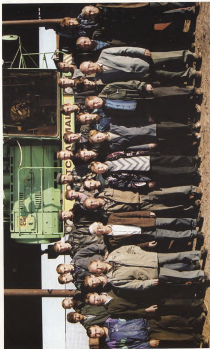
Колектив тракторної бригади ТОВ «Батьківщина»