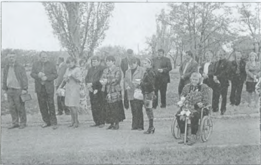
Учасники мітингу біля пам'ятного знака