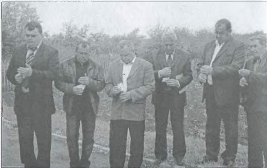
Горять свічки пам'яті