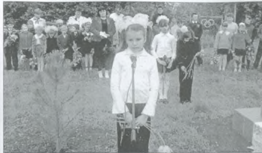
Ми пам'ятаємо невинно загублені душі