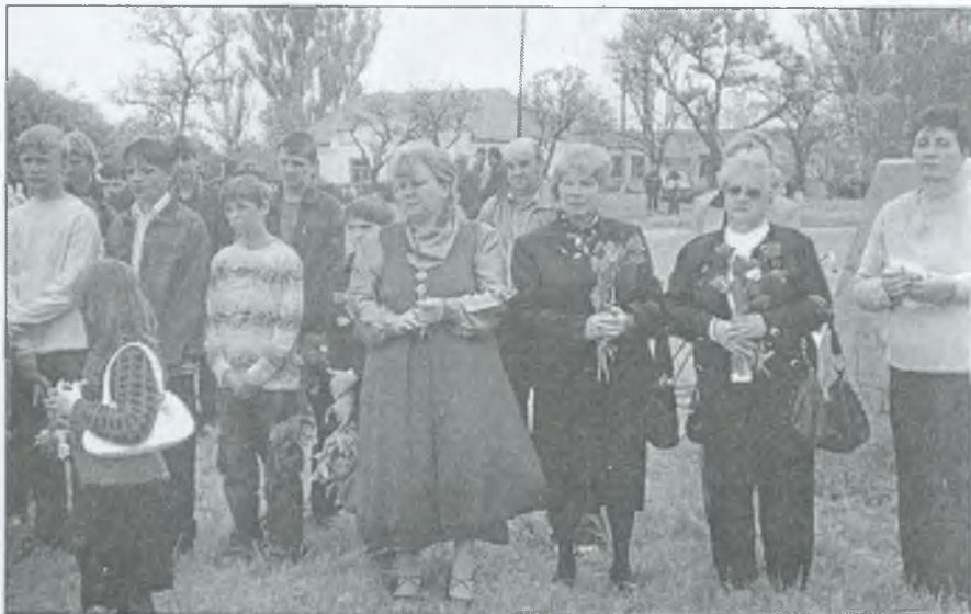
Для малинівців пам'ять нетлінна