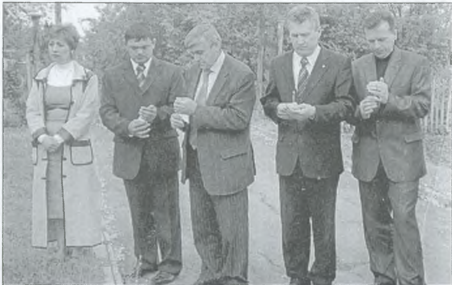
Горять свічки пам'яті