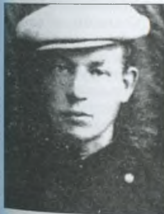
Вольдемар Генріхович Антоні

Весною 1908 року В. Антоні встав з поїзда аж біля австрійського кордону в місті Хотин. Він переходить на нелегальне становище під кличкою "Пантелейко", Переховувався в одного з учасників революційного руху під виглядом сторожа саду. Вів революційну пропаганду та переправляв у глиб Росії нелегальну літературу.