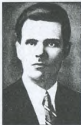
Нестор Іванович Махно. 1909 р.

Одним із учасників бойової групи "Союзу бідних хліборобів" був Нестор Іванович Махно, майбутній керівник Революційної Повстанської Армії України (махновців).