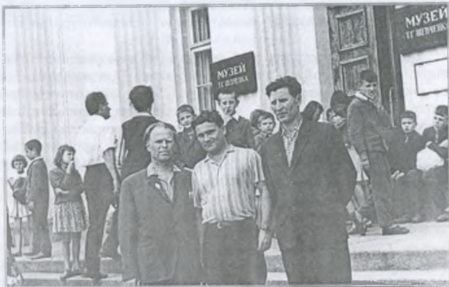
На екскурсії в м. Каневі. 1967 р.

Директор вночі готував необхідну наочну агітацію для коридорів і класів школи, сам писав, малював, маючи до цього відмінні здібності.