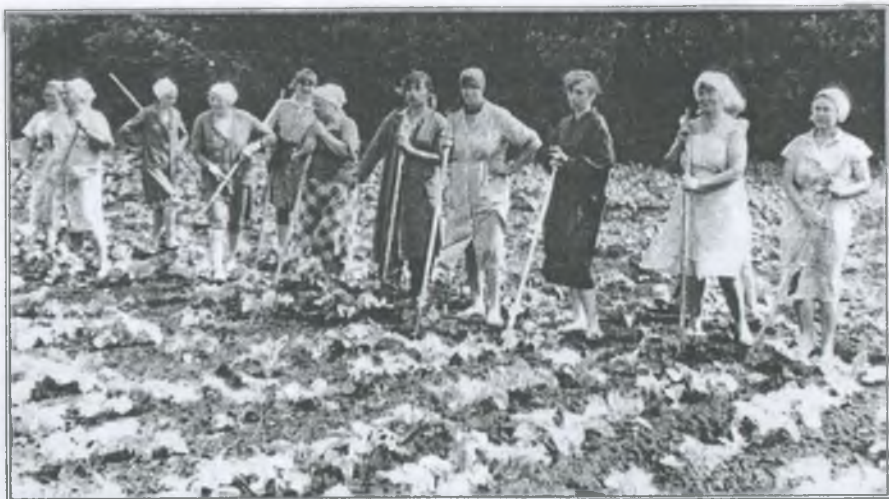
Працівники школи-інтернату на прополці капусти. 1992 р.

У підсобному господарстві вирощувались свині, корови, гуси. У саду достигали груші, яблука, абрикоси, черешні. Дорослі на зиму заготовляли для дітей компоти, повидло, варення. Олію теж мали свою. Все це давало можливість здешевити харчування дітей. Результати приходили не тільки після наполегливої праці дорослих, але і діти брали в цьому активну участь. Вони доглядали худобу, пололи просапні культури, збирали урожай сільгоспкультур. А найважливіше — учні готувалися посправжньому до свого майбутнього життя.