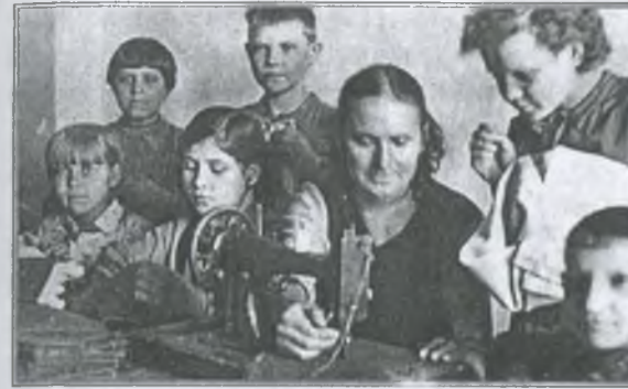
У майстерні з дітьми

Батько доклав чимало зусиль, щоб вирішити два першочергових завдання, — заскрити вікна і запастися паливом. Це було