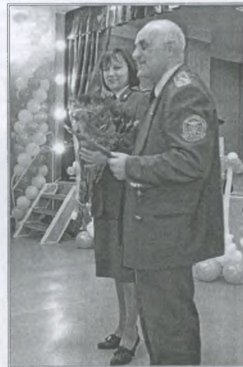
Друзі з обласної митниці гості школи-інтернату

На кожне дитяче свято спонсори привозять подарунки. Це канцтовари, іграшки, настільні ігри, солодоці. А випускникам школи — окрема увага, їм дарують дорожні сумки, фотоальбоми, годинники.