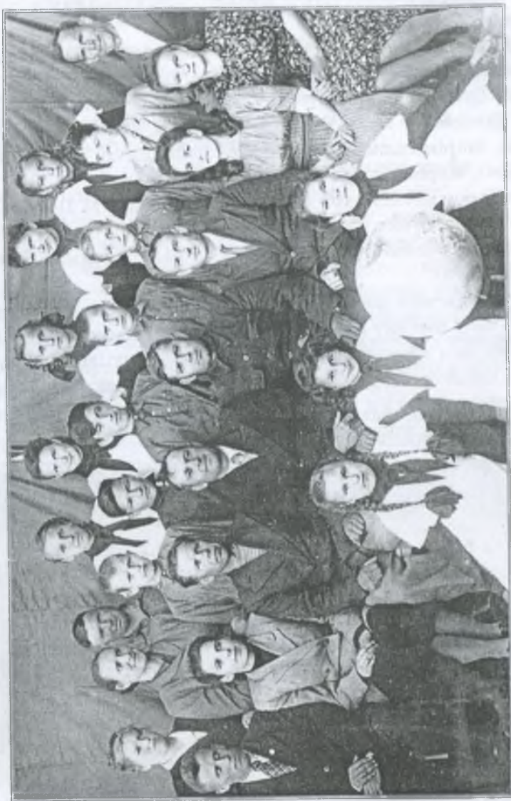
Перший випуск 7-го класу в дитбудинку № 1. 1951 р.

Нас вчили вишивати хрестиком, гладдю, рішельє. Вишиванки дітей возили на обласний огляд. Так і я вишила хрестиком портрет Т. Г. Шевченка на обласний огляд.