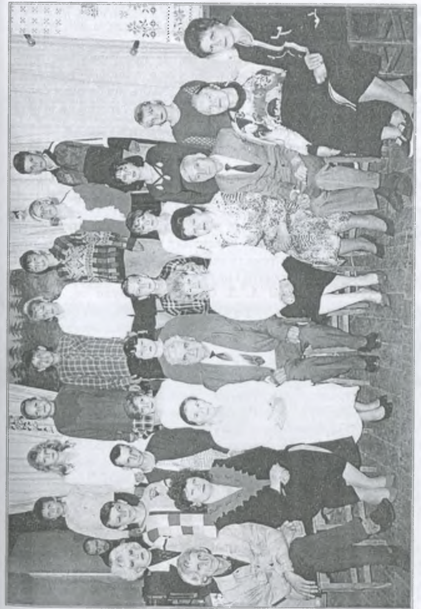
В день останнього дзвінка. 1999 р.