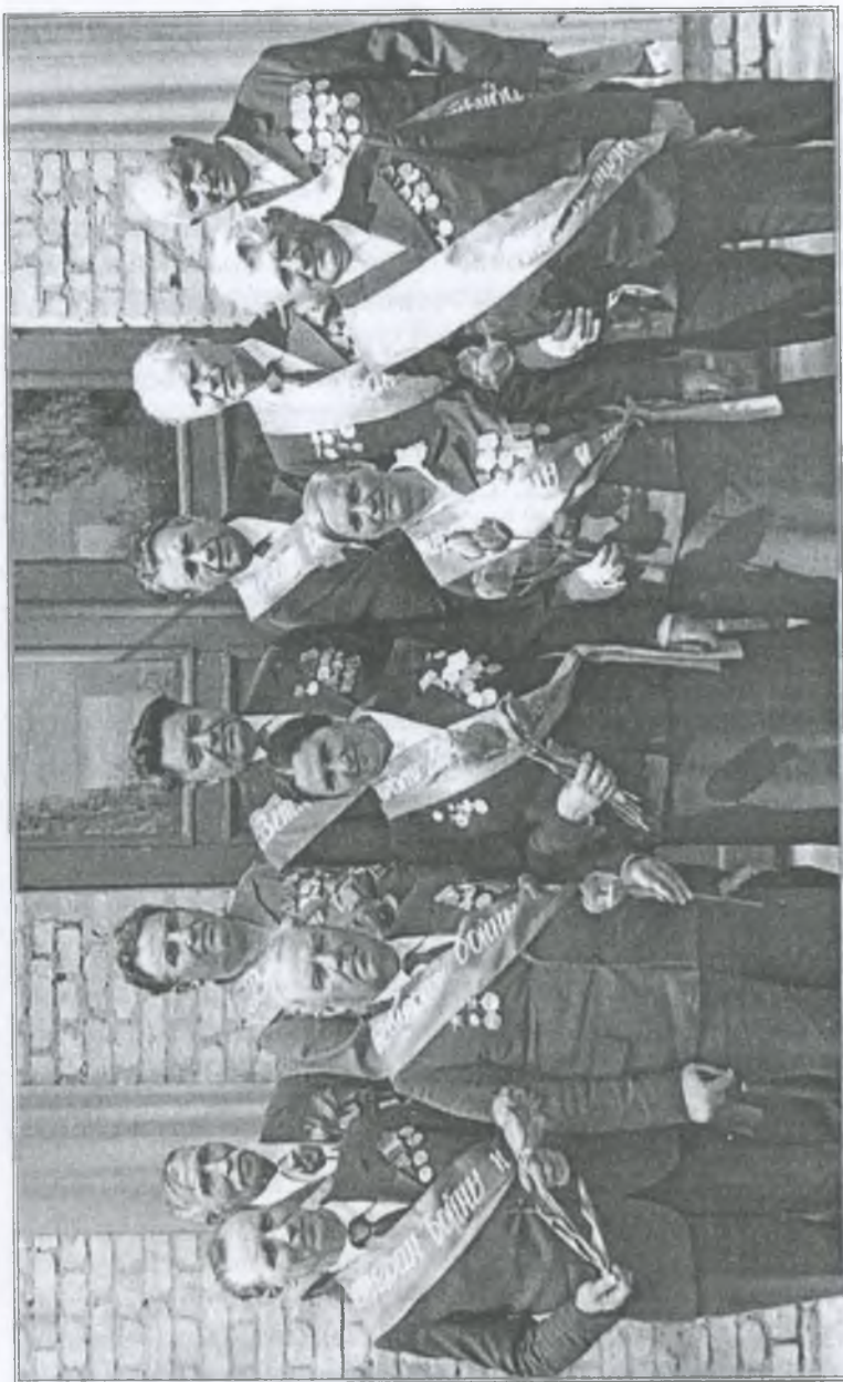
Ветерани війни — педагоги. 80-і роки минулого століття

оглядах художньої самодіяльності, де займав призові місця. За отримання першого місця в огляді художньої самодіяльності члени колективу в 1990 році були удостоєні поїздки на екскурсію до Москви. А райком профспілки освітян преміював переможців конкурсу художньої самодіяльності поїздкою по літературній Полтавщині.