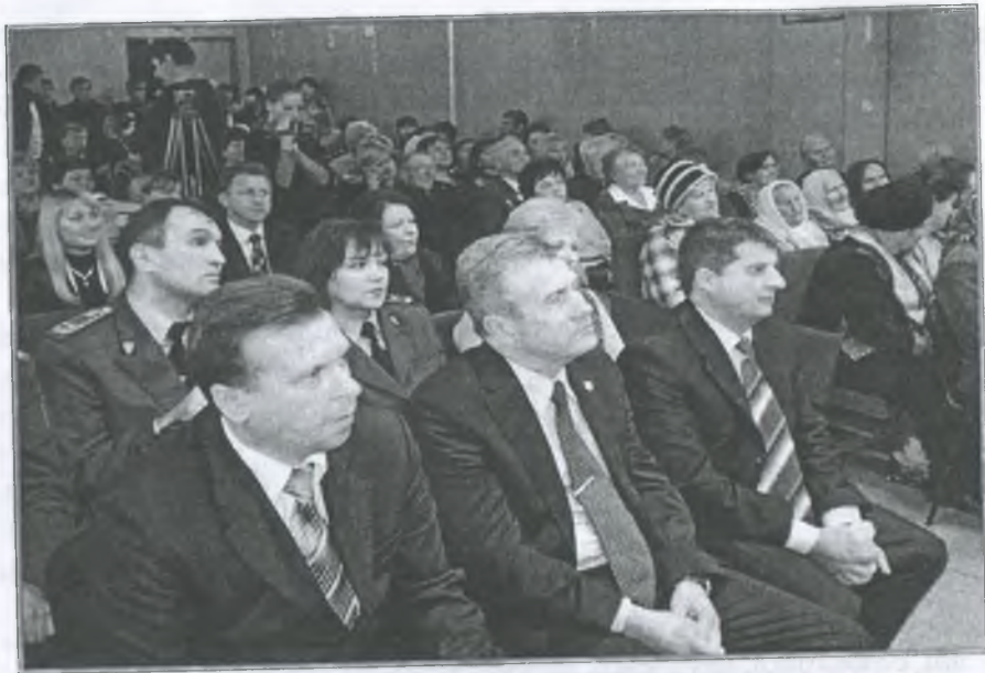
Почесні гості школи-інтернату

Побажати їм здоров'я, терпіння, добробуту і ще наголосити, не бійтеся інтернату. Далеко не в кожній сім'ї створені такі умови для дітей, як у цьому закладі. Повірте, вони наближені до умов заможних сімей.