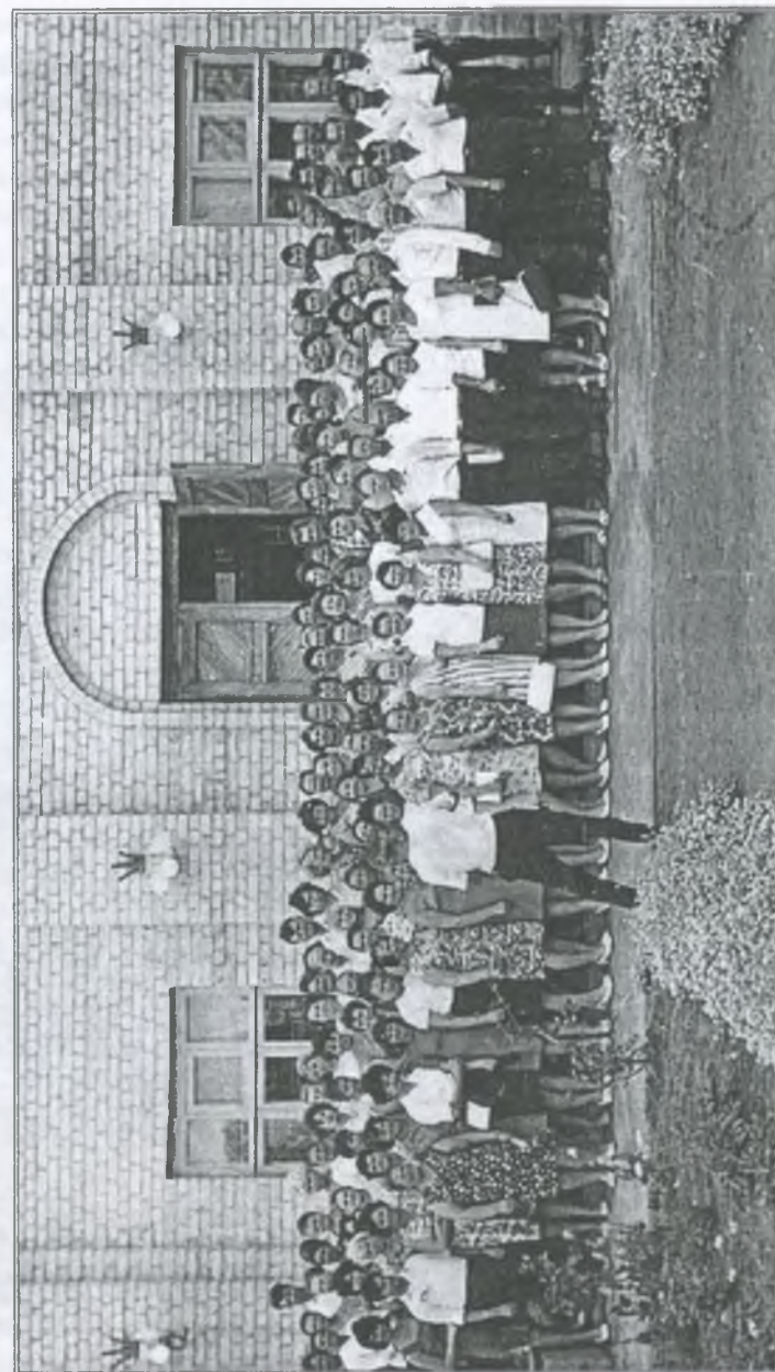
За досвідом до колег у школу-інтернат