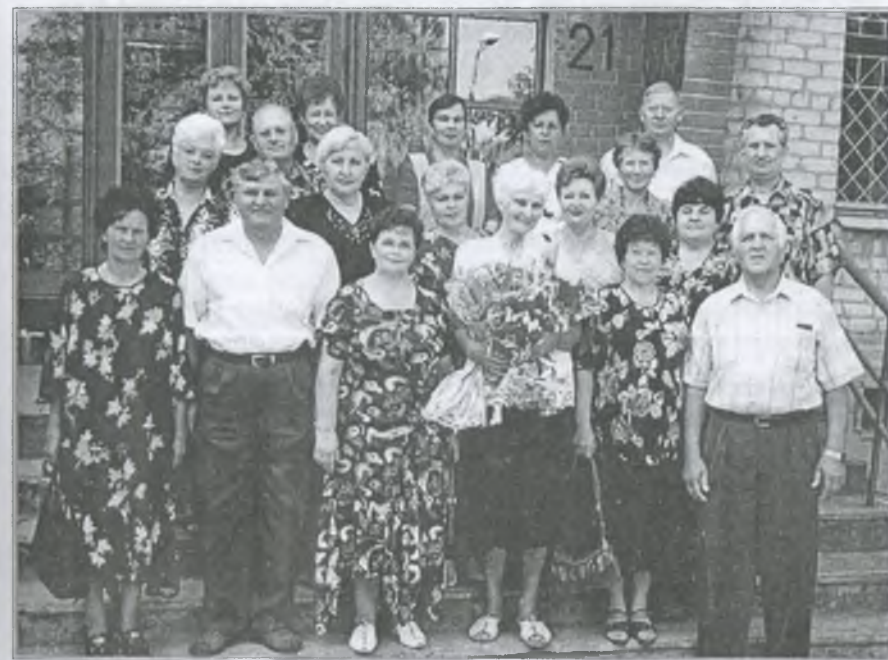
Зустріч через роки, через розставання. 13.08.2005 р.