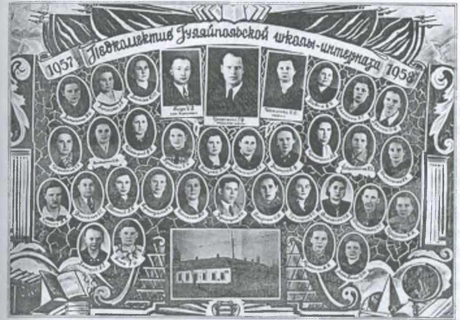
Педколектив школи-інтернату. 1957-1958 рр.