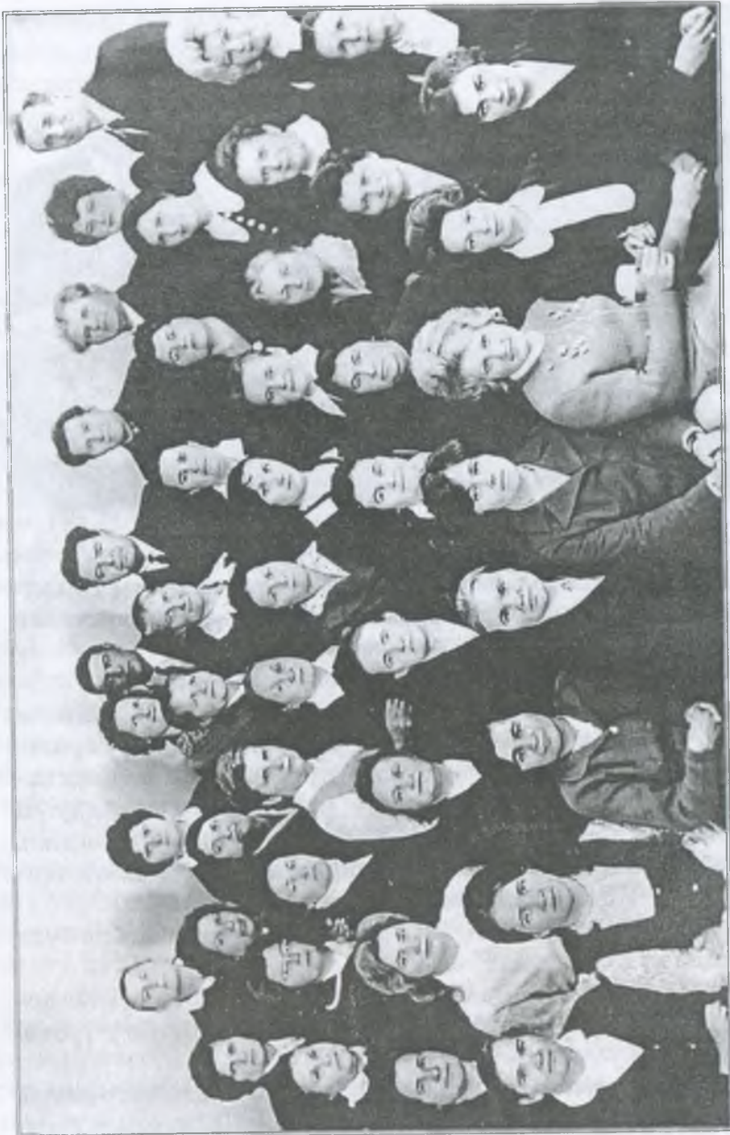
Дружна педагогічна сім'я

килимових виробів, зробили ремонт приміщення навчального корпусу. Шпалери, наклеєні на стінах в коридорах протрималися майже два десятиріччя. Цьому сприяло і те, що після Чорнобильської трагедії (1986 р.) тут відпочивали діти школи-інтернату № 10 міста Києва зі своїм завучем та вихователями. Кошти держава виділила великі і школа значно покращила своє матеріальне становище.