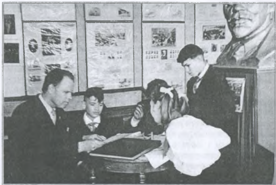
Визріває колективна творча думка

подарунки, виготовлені своїми руками: рамочки, полочки, шкатулки — випиляні і випалені — на черговому "вогнику".