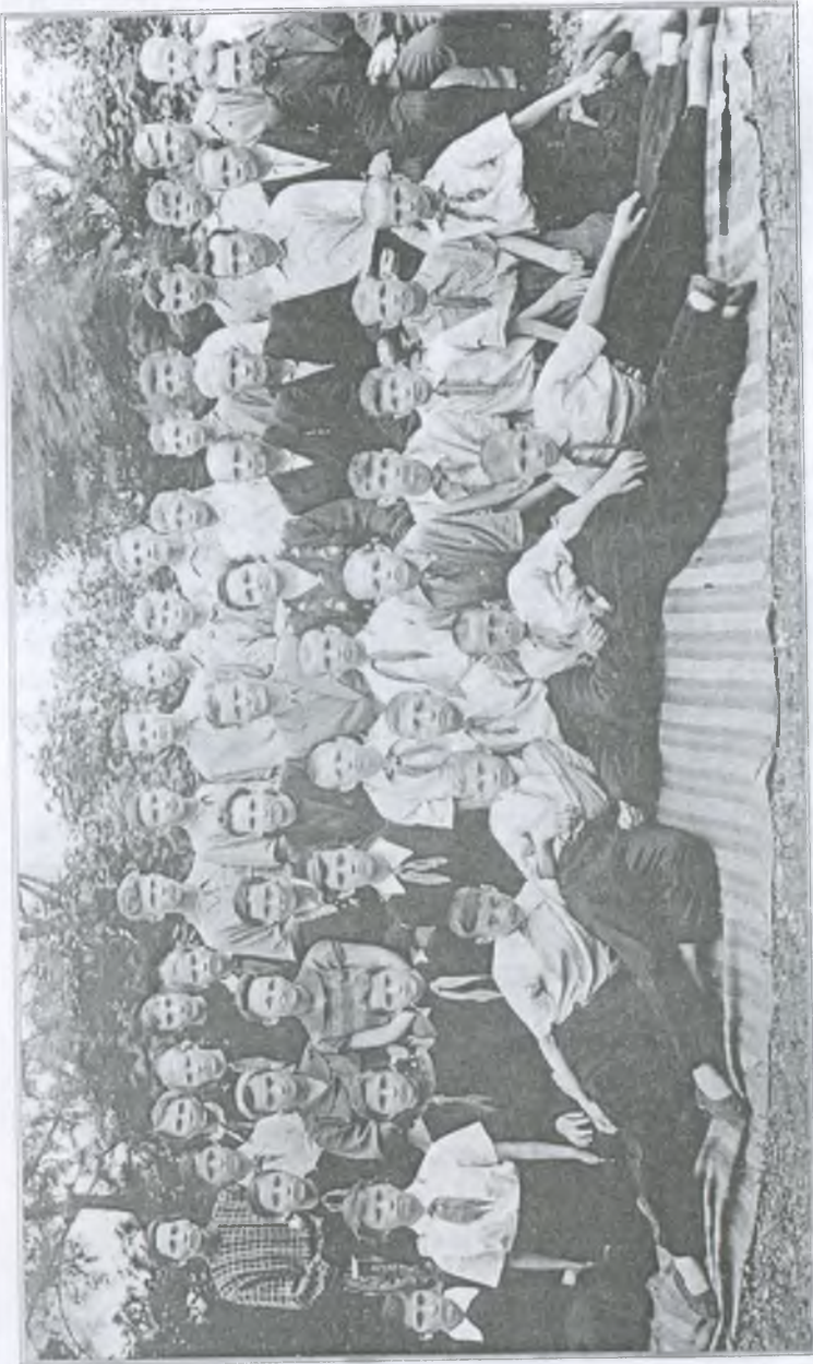
Випускний сьомий клас. 1957 р.