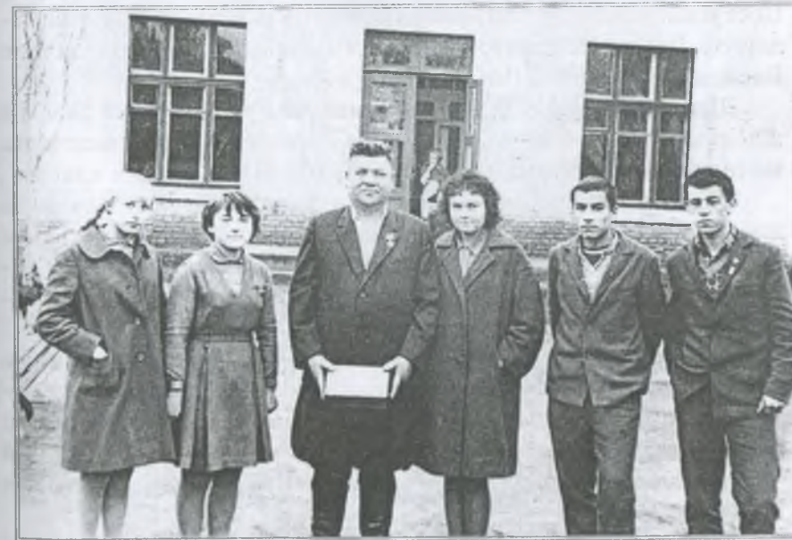
У гостях Герой Соціалістичної Праці О. О. Зачепило

Тодішніх вихованців школи-інтернату білоручками, неробами не назвеш. Учні самі, по черзі, прибирали і в класних, і в спальних кімнатах, і чергували в їдальні, і наводили порядок на території школи. А також працювали в підсобному господарстві. Так непомітно й минали шкільні роки і в травні 1964-го року пролунав для нас останній дзвоник. А після випускного вечора розлетілись мої однокласники хто куди, немов пташенята з