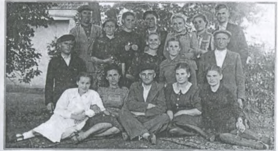
Педколектив дитбудинку № 1

У 1948 році було придбано домровий оркестр за 15000 карбованців. У 1949 році в огляді художньої самодіяльності дитбудинку