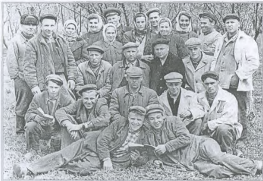
Будівельники нової школи. 1957 р.

вати в дитбудинку вона почала десь в 1956 році на посаді піонервожатої.