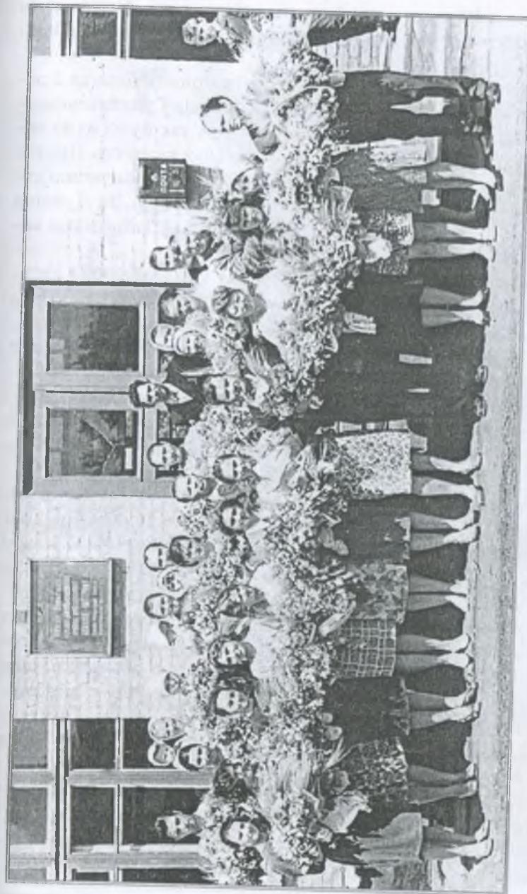
Свято останнього дзвоника. 1964 р.

Учні по черзі прибирали в класах, спальнях. Навіть хлопці підбілювали стіни, де було необхідно, старалися, бо медсестра