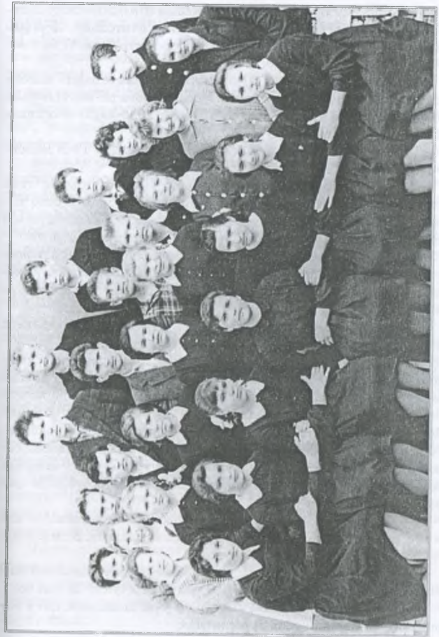
Випускний 11-й клас школи-інтернату. 1965 р.