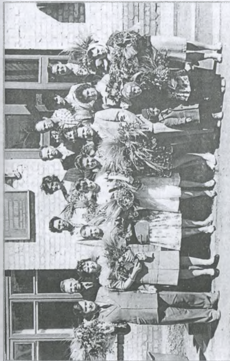
Педколектив школи-інтернату. 1963 р.