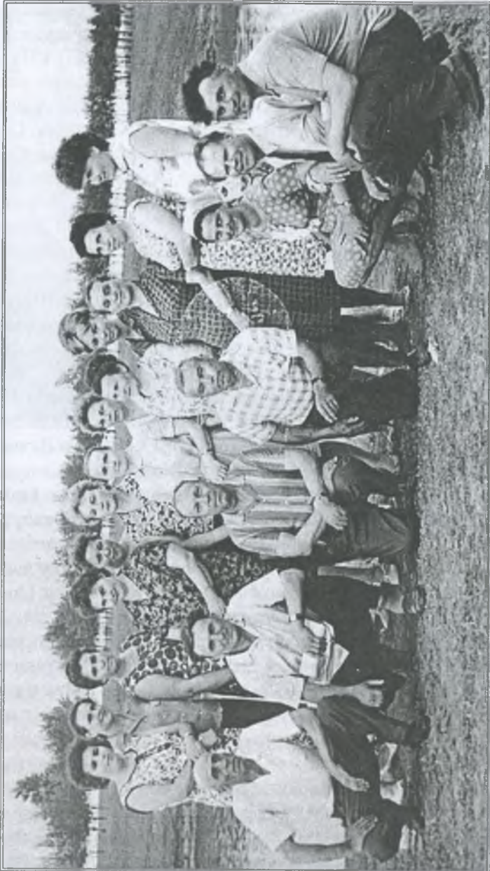
До школи-інтернату завітали гості. 1968 р.

При цьому довелось віддати колгоспу частину шкільної землі, на заміну вирізаної для дороги. Її побудували і рейсовий автобус регулярно ходить до інтернату.