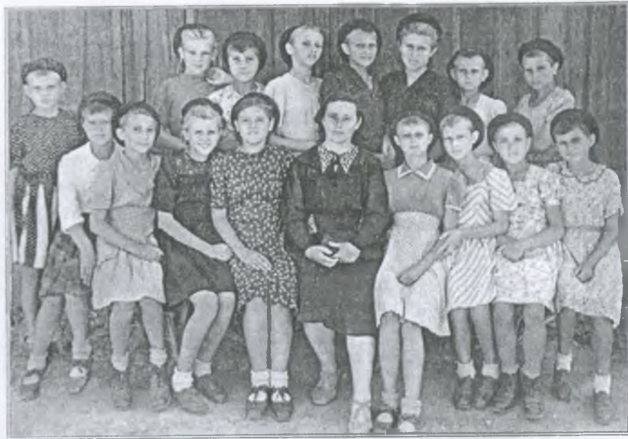
Старша група дівчат

ке приміщення, де розміщались семирічна школа і їдальня з кухнею; окреме приміщення — пральня і лазня; велике приміщення — для майстерень і маленький будинок — ізолятор для тих, хто тільки прибув, куди їх поміщали на кілька днів. Там був і медпункт.