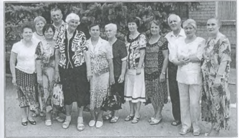
Такі ми через 45 років. 2010 р.