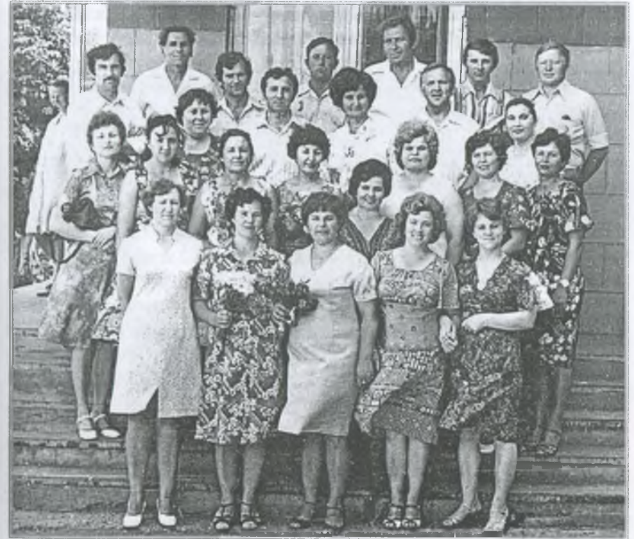
Зустріч однокласників через 15 років. 1980 р.

В 1964 році інтернат відзначав своє 5-річчя. З цієї нагоди