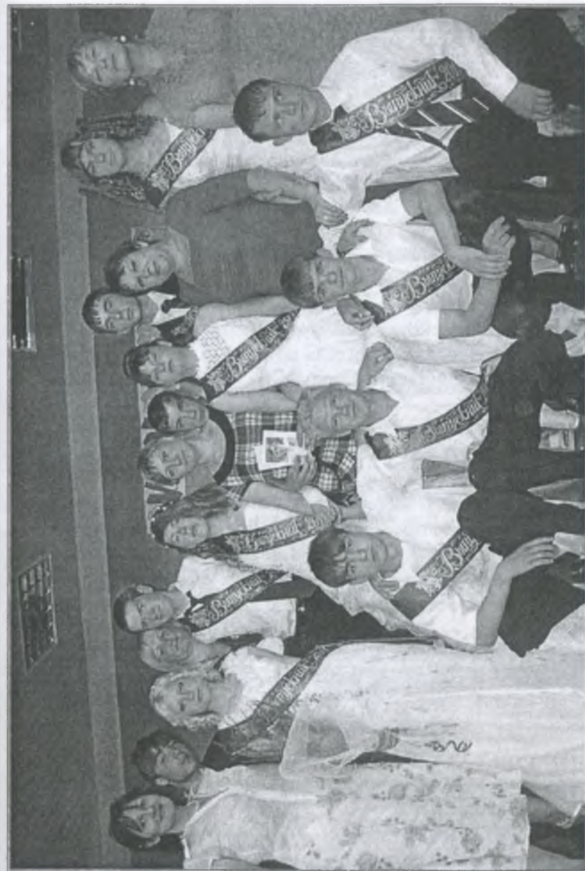
Перед вильотом у самостійне життя

— Сьогодні ми святкуємо 55-річний ювілей, тим самим підбиваючи підсумки нашої роботи. Що можна сказати? Школа! Як багато в цьому слові! Це і затишні, комфортні спальні, це впорядковані класи, це трудолюбиві педагоги, це і чуйний службовий персонал, ну і, звісно, наші діти. Цього вечора я зустрів багато випускників і, чесно кажучи, серце защеміло, адже приємно бачити вихованців, які змогли досягти чогось у цьому нелегкому житті. Повірте, що за останні 5 років це були діти, в яких не було ні батька, ні матері. Не можу не сказати й того,