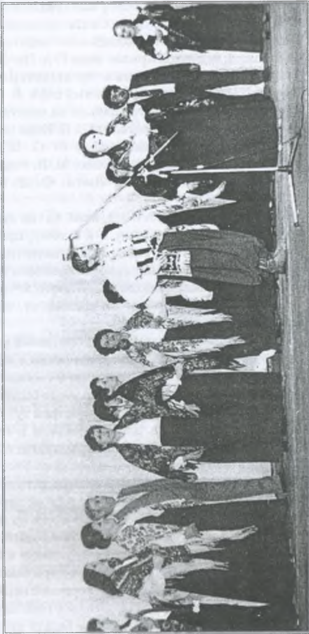
На сцені КСК "Сучасник" учасники шкільної художньої самодіяльності