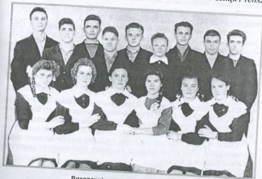
Вихованці школи-інтернату. 1963 р.

— В цій школі (тоді це ще дитбудинок) я працював з 1946 року, а моя дружина Зінаїда Андріївна — з 1948-го. Я працював конюхом. Спочатку було 7 коней, потім двоє передали в інший дитбудинок, залишилось 5 (2 пари + одна кобила). Було 5 волів,