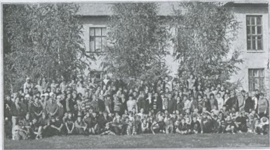
Учні і працівники школи-інтернату