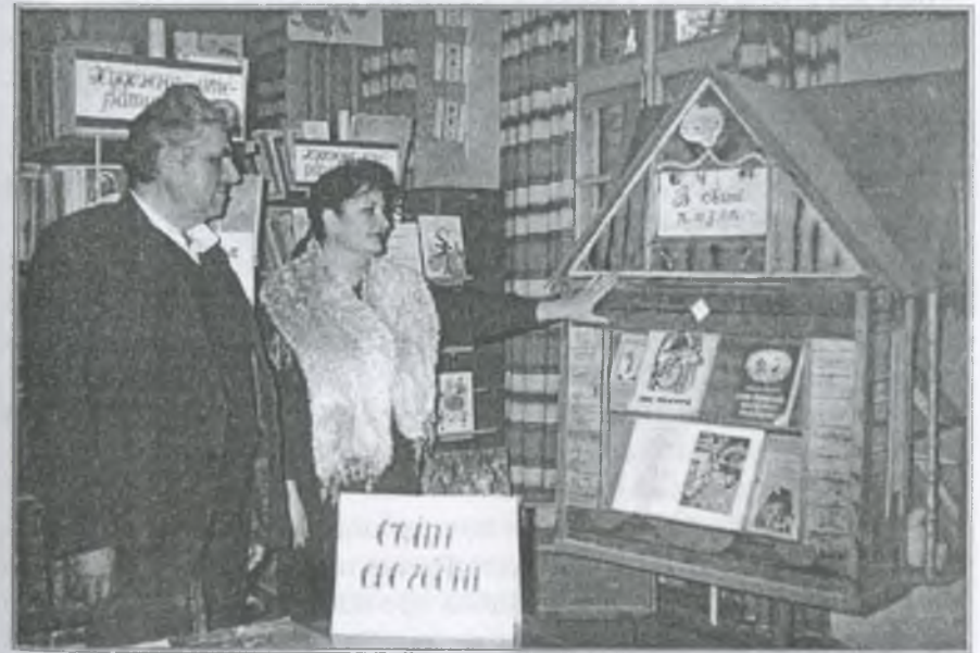
У шкільній бібліотеці