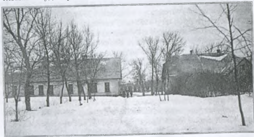
Зимовий вечір у дитбудинку

Через кілька хвилин ми були в одному з найкращих в Запорізькій області — Гуляй-Пільському дитячому будинку. В ньому виховуються діти, батьки яких загинули в роки Великої Вітчизняної війни. Тут сини і дочки воїнів Радянської Армії, партизанів. В будинку діти оточені батьківським піклуванням і увагою.