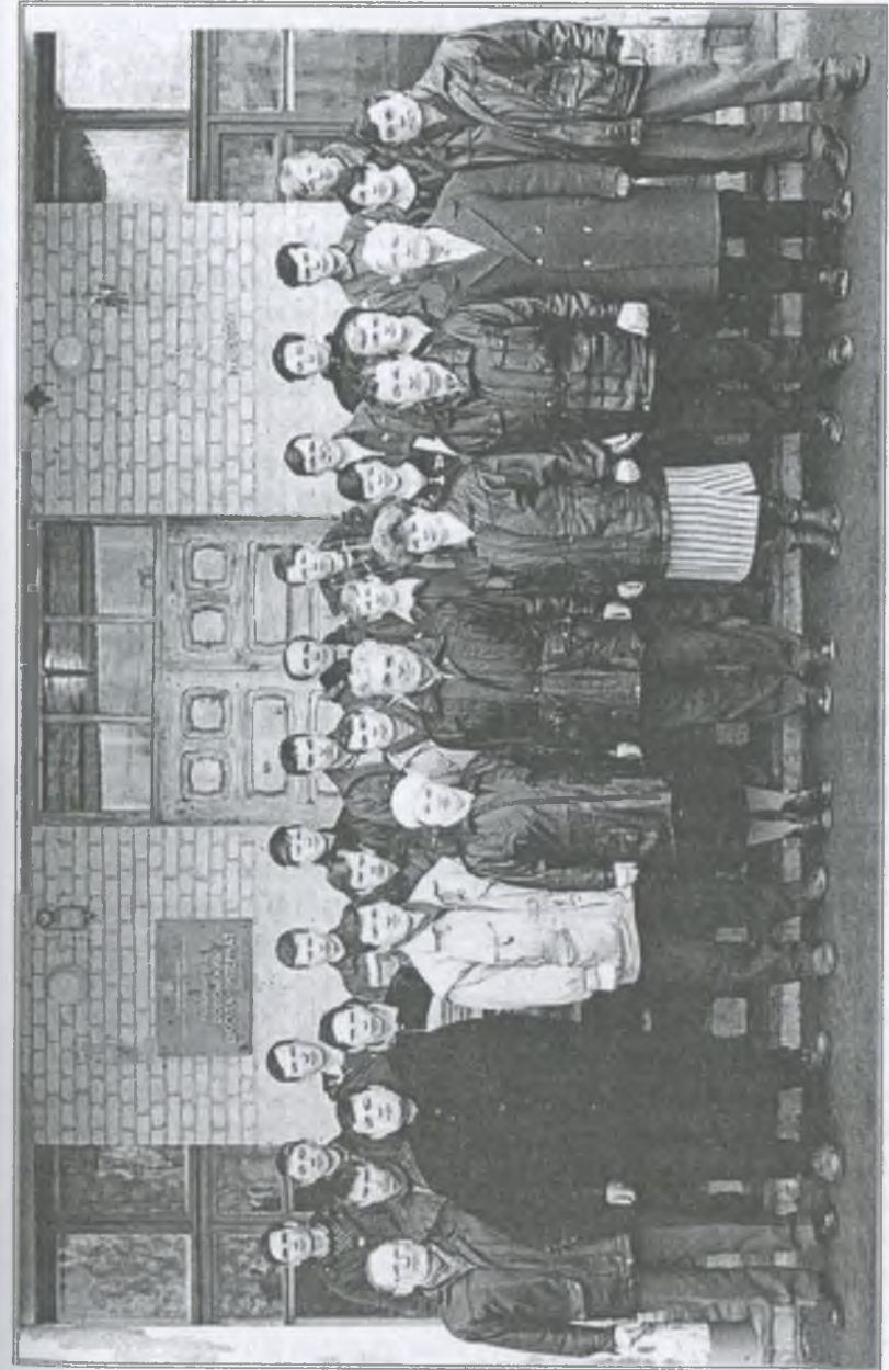
Діти отримали посвідчення тракториста