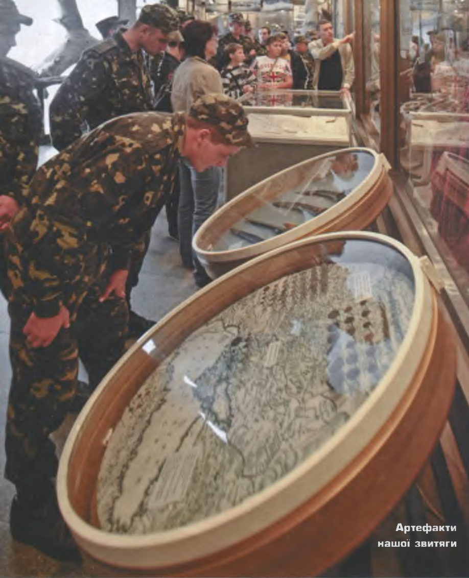
Артефакти нашої звитяги