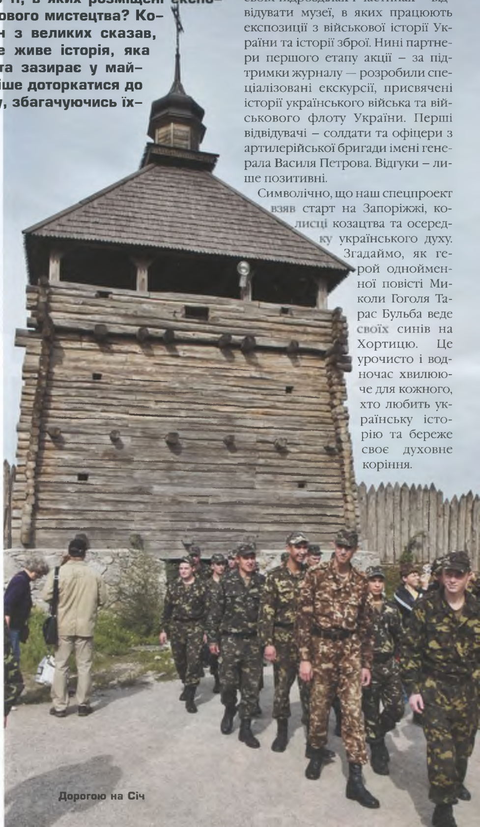
Дорогою на Січ

Згадаймо, як героєм однойменної повісті Миколи Гоголя Тарас Бульба веде своїх синів на Хортицю. Це урочисто і водночас хвилююче для кожного, хто любить українську історію та береже своє духовне коріння.