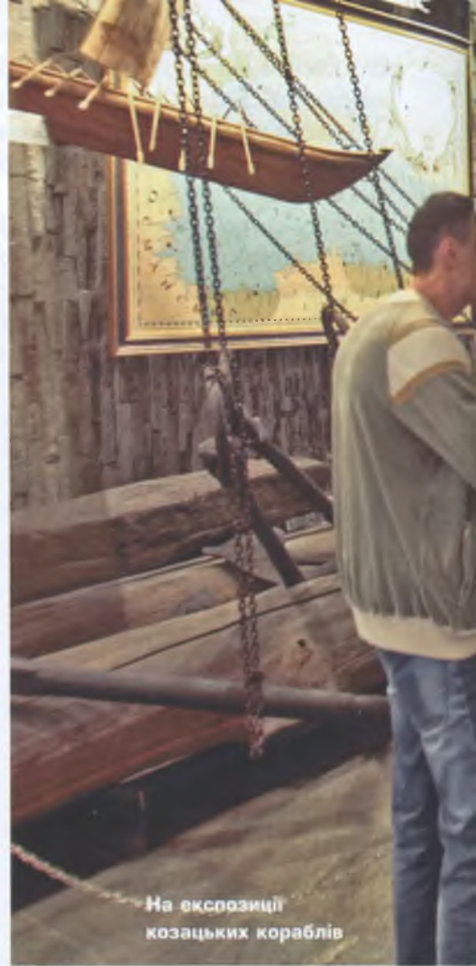
На експозиції козацьких кораблів