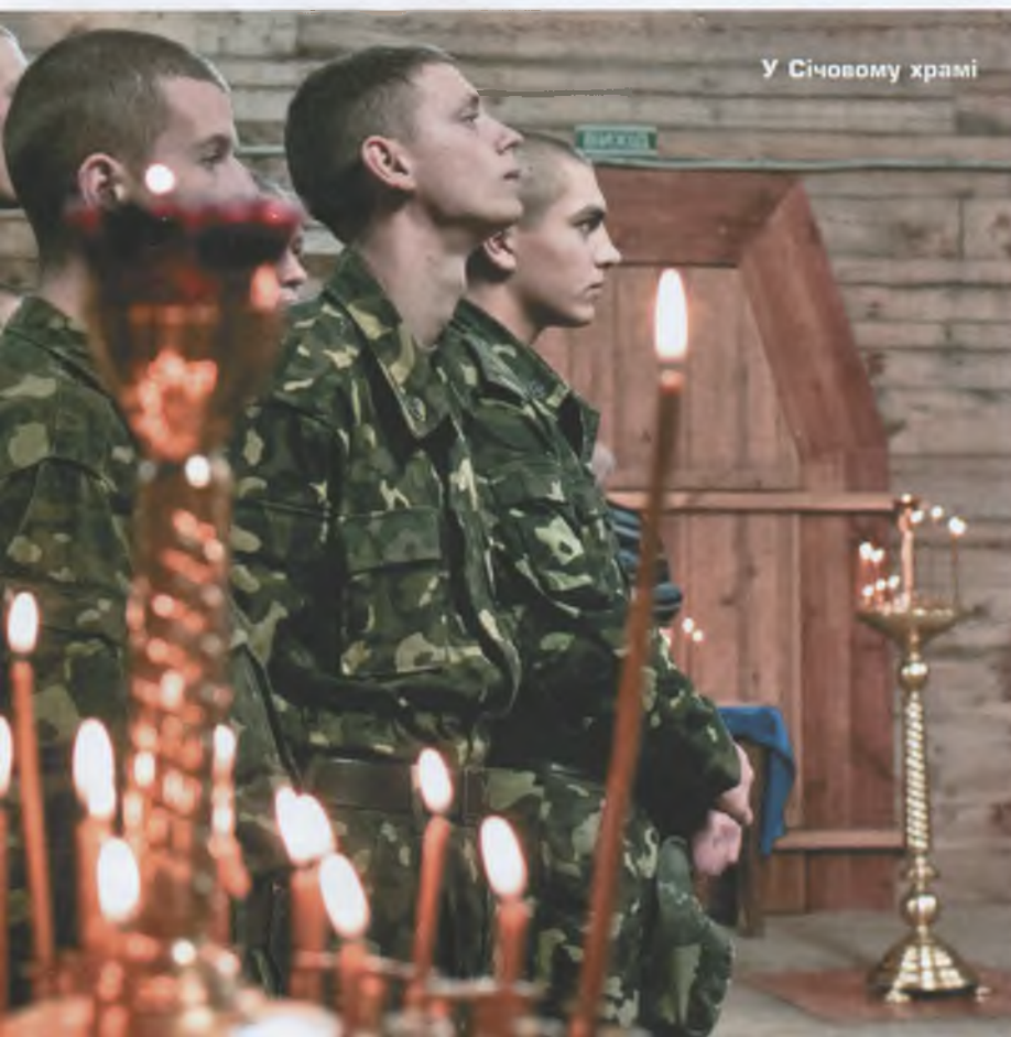
У Січовому храмі