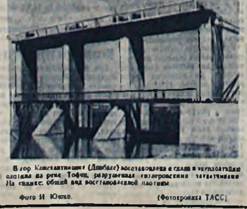
В гор. Константиновке (Донецк) восстановлена в связи с реконструкцией системы водоснабжения водонапорная вышка.

В 1929 году В. И. Ленин заявил: «Россия отстала экономически от остальной страны, имеет в области оборудования, промышленности, культуры, науки, искусства, искусства хуже Америки».