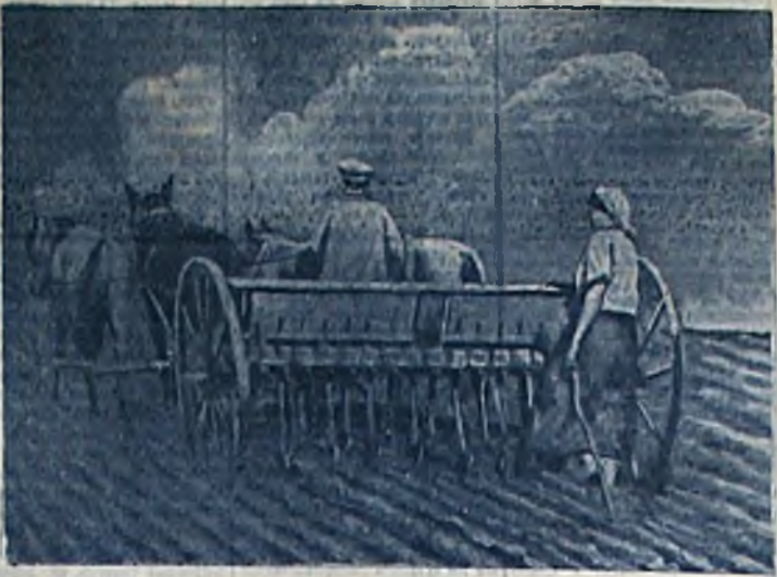
Сев озимки в колхозе им. Калашникова Киевско-Днепропетровского района.

Важным фактором успеха является организация труда колхозников. Необходимо обеспечить равномерную нагрузку на работников и обеспечить их необходимыми инструментами и материалами. Также важно организовать работу по обеспечению работников необходимой информацией и поддержать их энтузиазм.