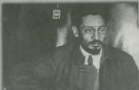
Яков Свердлов – жестокий «президент» Советского государства