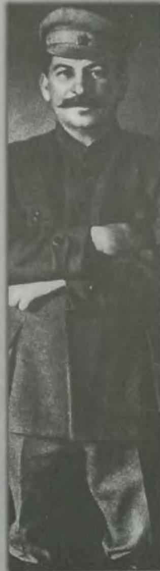
Иосиф Сталин высоко оценил боеспособность войска батяки Махно