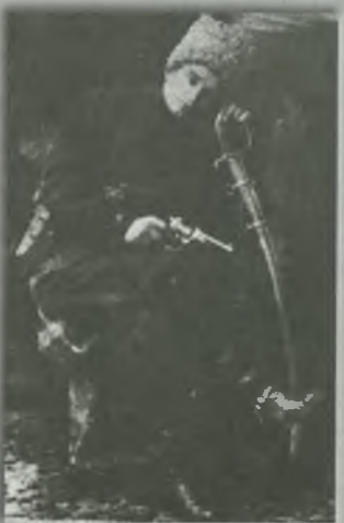
Александр Лепетченко – один из ближайших соратников Махно. Расстрелян красными в 1920 году