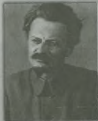
Лев Троцкий – злой гений революции