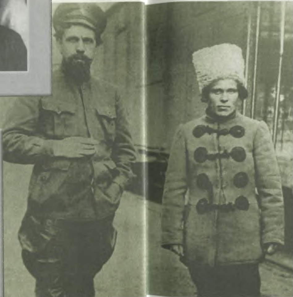
Нестор Махно и легендарный красный командир Павел Дыбенко. 1919 год