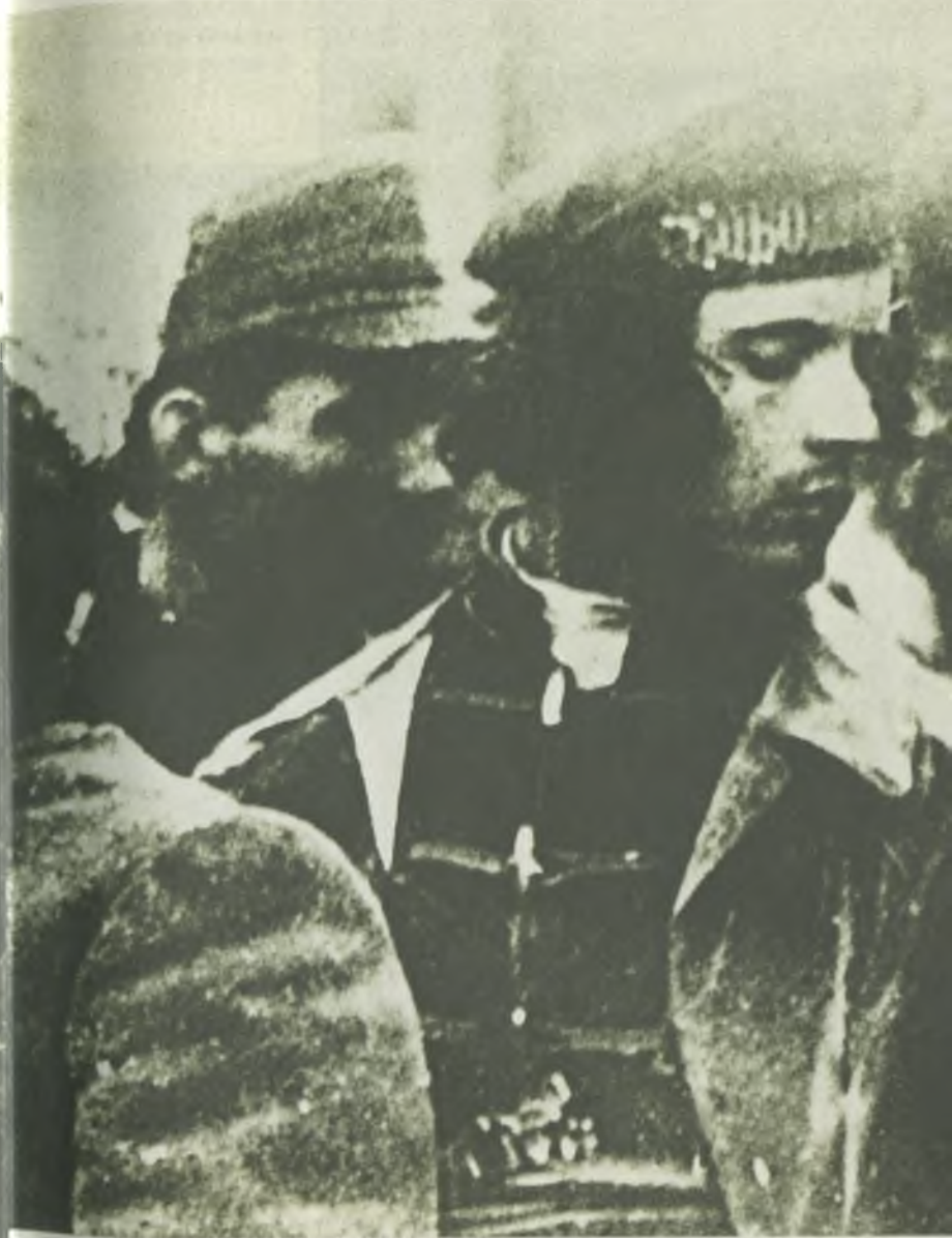
Нестор Махно и его командиры