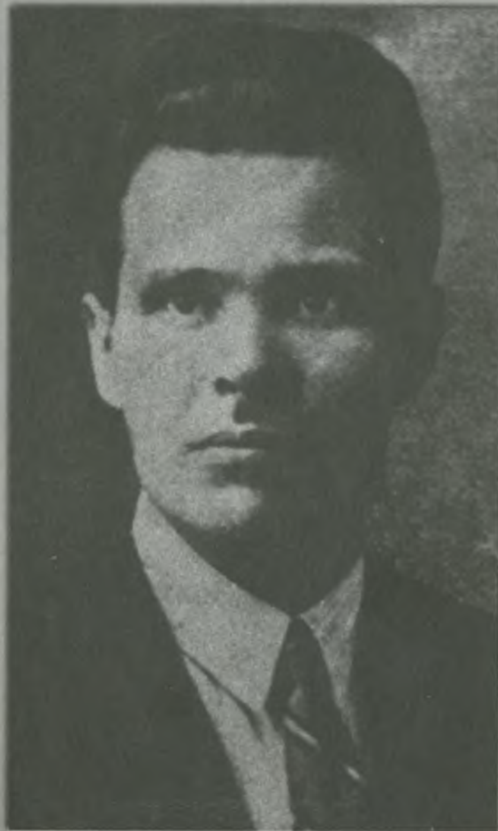
Разве узнаешь в этом человеке грозного батьку Махно? Париж, конец 20-х годов