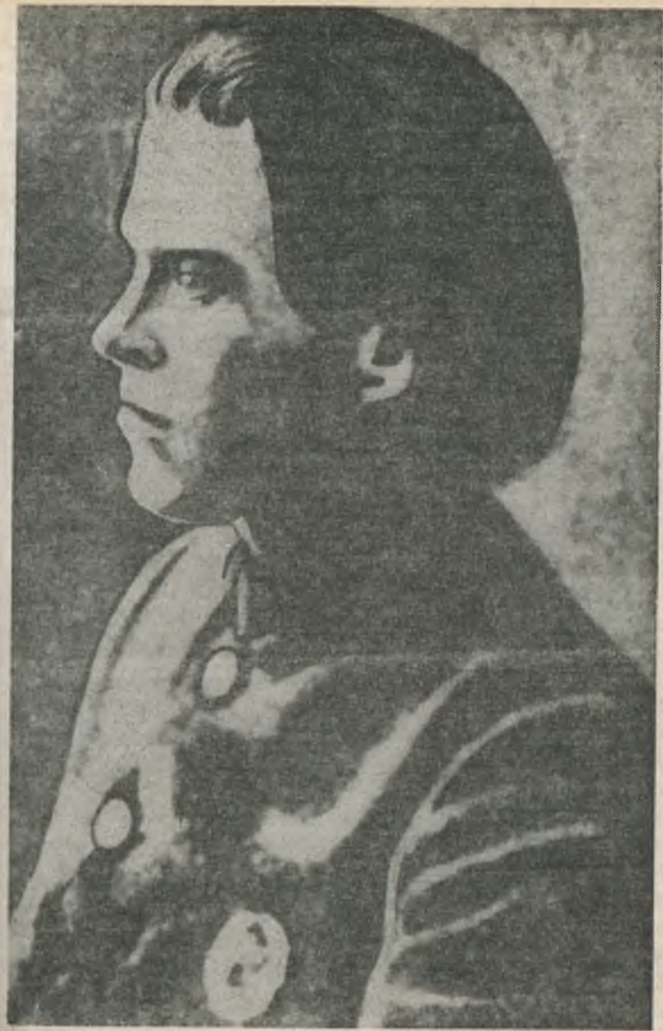
Н. И. Махно с орденом Красного Знамени. 1919 г.