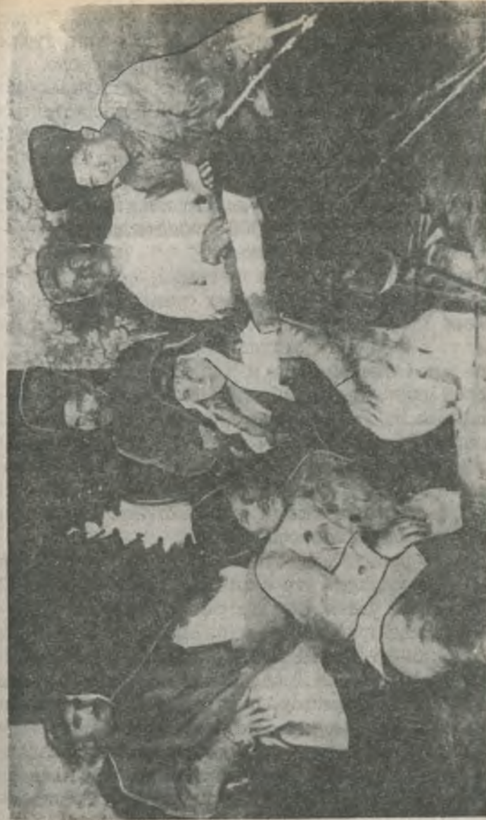
Н. Махно и Г. Кузьменко (в центре) среди раненых махновцев в Старобельском госпитале.

После подписания соглашения махновцы получили отдых перед броском во врангелевский тыл, а раненые были помещены в советские госпитали Старо-