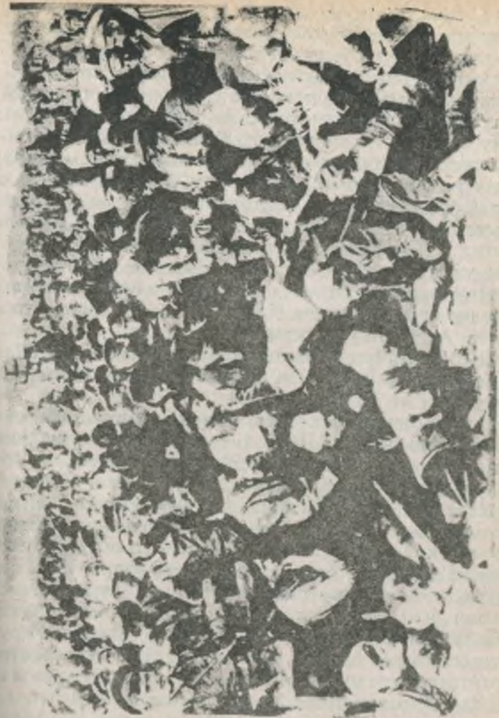
Махновцы обсуждают условия Старобельского соглашения.

Надо сказать, что всегда вокруг основных сил Махно «крутились» мелкие банды, которые действовали чуть ли не в каждом селе. Теперь некоторые из них понимали, что с уходом Махно на Врангеля на них обрушат всю свою мощь войска ВОХР и поэтому принялись улучшать свое положение. Используя ситуацию, принялись формировать новые отряды, а эти операции могли обернуться для Махно возобновлением боевых действий. Поэтому Махно вынужден был принимать меры, рассчитывая на смягчение обстоятельств. Вот как документ рассказывает нам об этом. Высланная разведка от 56-го полка в сторону Петропавловки встретила ординарца от Махно, который передал депешу за № 76 следующего содержания.