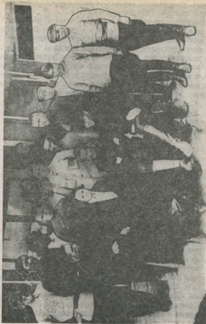
Махновцы в варшавской тюрьме. В центре Н. Махно и Г. Кузьменко.