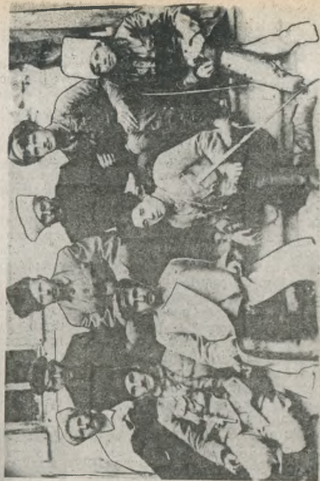
Махновский штаб, заключивший соглашение о совместных действиях с Красной Армией против Врангеля.

Можно без преувеличения сказать, что мысль о совместных действиях с Красной Армией против