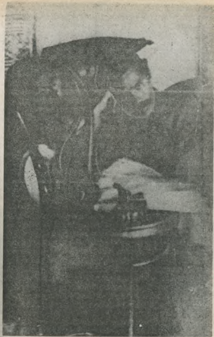
Махно в советском госпитале в г. Старобельске.