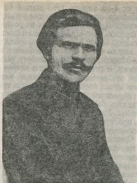
Н. Махно. Варшавская тюрьма, 1923 г.