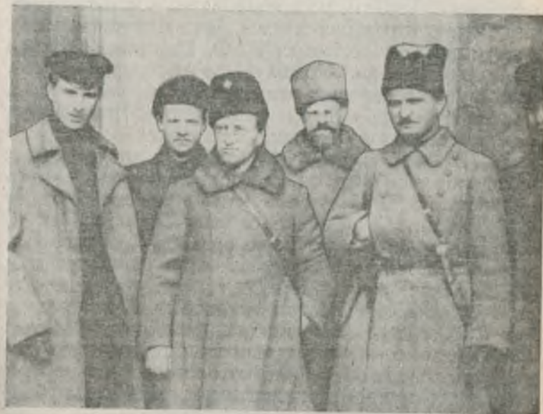
В. А. Антонов-Овсеенко (в центре) с группой военных. Укрфронт, 1919 г.

В начале апреля 1919 года произошли важные события. После того как махновская 3-я Заднепровская бригада очистила от денкинцев Волноваху и