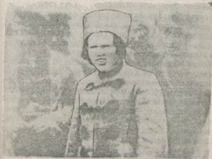
Комбриг Махно со своим штабом встречает командующего Укрфронтом В. А. Антонова-Овсеенко 29 апреля 1919 г. Гуляйполе

чувствовалась острая нехватка оружия и боеприпасов. В. А. Антонов-Овсеенко так об этом писал: «Все вооружение и обмундирование добыто с боя» Позже, анализируя ситуацию, писал: «Органы Наркомпрода не удовлетворяли и одной сотой потребности армии полубосой, полуголодной. Армия жила на подножном корму»