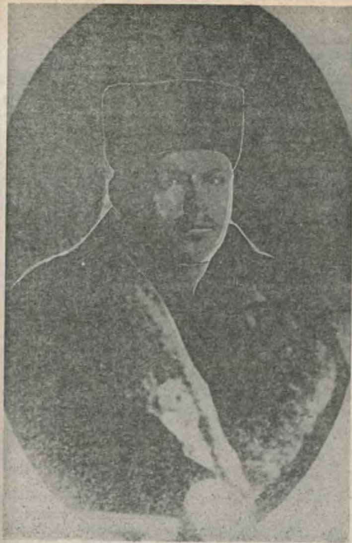
Нестор Иванович Махно в 1917 г после возвращения с каторги.

Думаю, что в этом описании есть некоторая тенденциозность. Это видно из такого примера. В 1991 году журнал «Дружба народов» опубликовал роман «Полюшко-поле». Его автор — израильский писатель Давид Маркиш. В романе описана совсем противоположная махновская коммуна. В ней не пьянствуют и