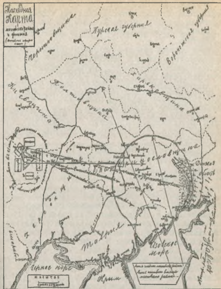
Наглядная карта зон главного и активного влияния Махно на Украине.

Приведенный выше документ позволяет нам лучше ориентироваться в действиях махновцев на территории данной губернии. Это наглядно видно из карты, взятой нами из журнала «Дружба народов» № 6 за 1991 г., где линия главного махновского района обозначена: Мелитополь — Екатеринослав — Бахмут — Мариуполь, а это значит, что в эту зону попадала значительная часть Донецкой губернии. Линия же активного влияния махновского района Таганрог, Харьков, Старобельск, Миргород, Одесса почти полностью охватывала всю Донецкую губернию. Следовательно ввиду того, что ее территория входила в зону главного и активного действия махновцев, то вся тяжесть борьбы с армией батьки Махно падала на органы Донецкой губернии.