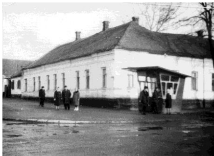
вул. Лепіка, 12 (Дніпровська) 1952-1977 рр.