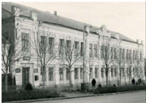
пр. Леніна, 92 (Соборна) 1920-1935 рр.