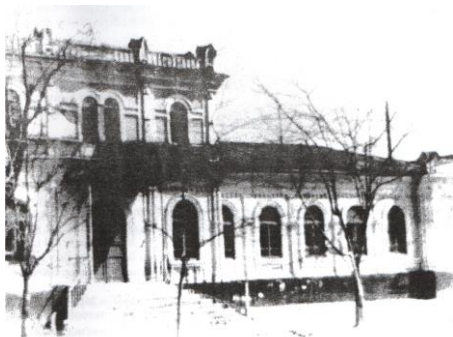
вул.Дзержинського,6 (Олександрівська) 1905-1909 рр.