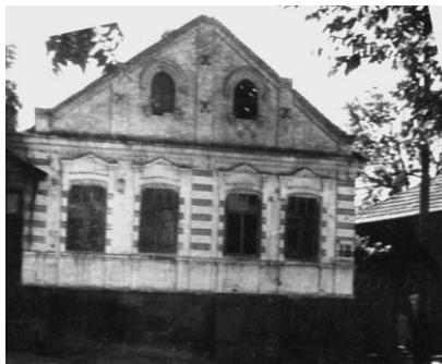
вул. Чекистів, 18 (Троїцька) 1935-1939 -1941 рр.