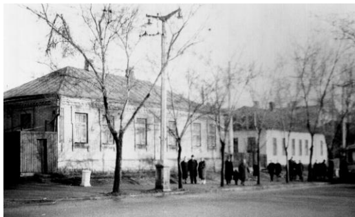
1965 р. – на цьому місці побудовано Палац книги