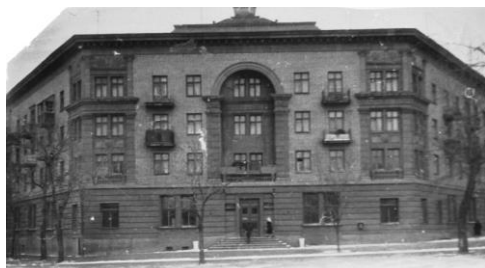
вул. Лобановського (Спортивна) 1944-1952 рр.