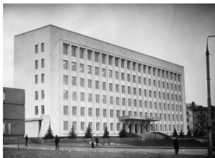
1977 р. - пр. Леніна, 142