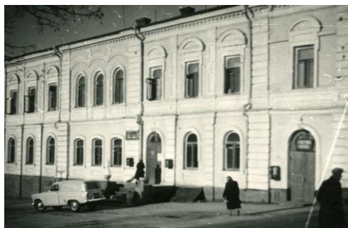
вул. Свердлова,21 (Покровська) 1909-1918 рр.