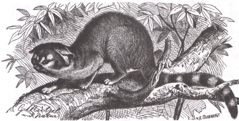
Североамериканский какомицли ( Bassariscus astutus )

* Брем имеет в виду прежде всего северного какомицли. Южный вид считается более древесным и, по-видимому, реже спускается на землю.