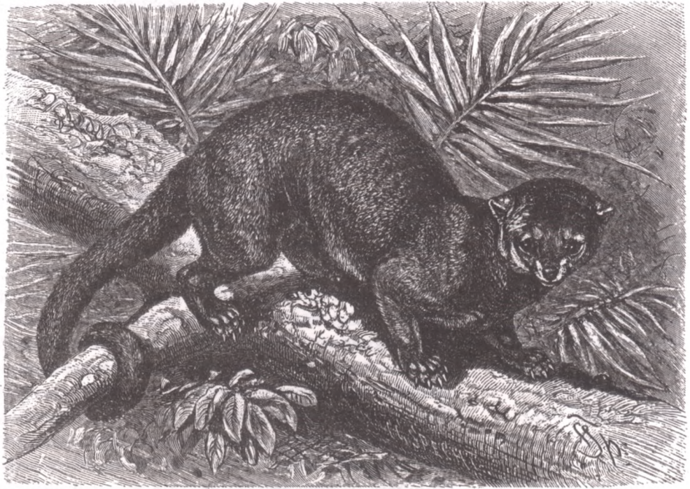
Кинкажу ( Potos flavus )

Теперь мы знаем, что кинкажу очень распространен. Он водится во всей северной Бразилии, в Перу и севернее до Мексики, так же как и в южной Луизиане и Флориде. Живет в девственных лесах, часто близ больших рек и обычно на деревьях. Ведет ночной образ жизни; днем спит в дуплах, ночью же очень подвижен и лазает замечательно ловко по верхушкам деревьев, ища себе пищи. Его цепкий хвост оказывает ему хорошую услугу. Кинкажу в искусстве лазанья едва уступает обезьянам. Все его движения в высшей степени спокойны и самоуверенны. Он может держаться за сучки и ветки задними ногами или цепким хвостом и так крепко зацепляется ими за дерево, что слезает с них всегда головой вниз. Когда он ходит, то ступает на всю ступню.