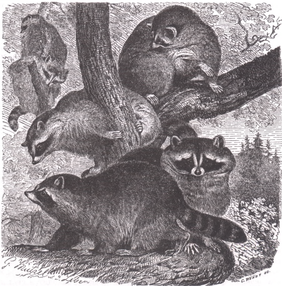
Енот-полоскун (Procyon lotor)

убежище на земле. Подростки детеныши остаются с матерью до конца зимы.