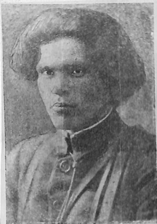
Петр Иванович Махно.