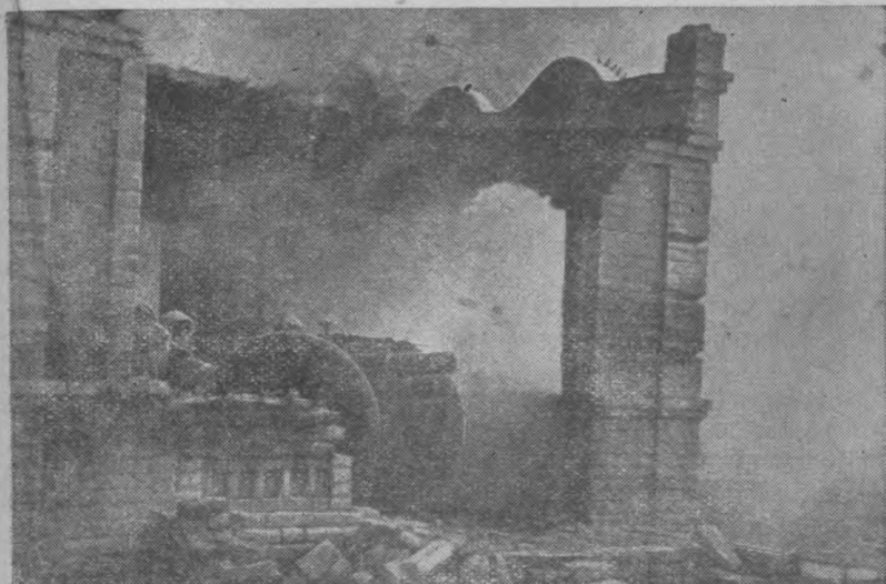
Бои на улицах Мелитополя. Орудие бьёт прямой наводкой по засевшим в соседних зданиях немцам.

Но этим боевые действия наших танков и артиллерии не ограничивались. В ходе борьбы на улицах Мелитополя артиллеристы, взаимодействуя с танками, подавляли противотанковые средства немцев, а танкисты, курсируя по улицам на своих боевых машинах, расстреливали бесчисленные гнёзда фашистских автоматчиков.