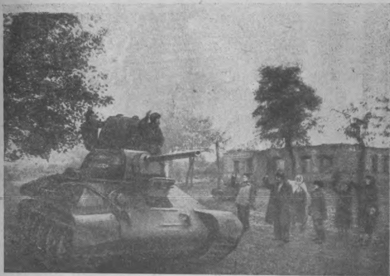
На улице Карла Маркса. Жители Мелитополя приветствуют советских танкистов—своих освободителей.

обгоревших танков, бронемашин, самоходных орудий и другой военной техники.