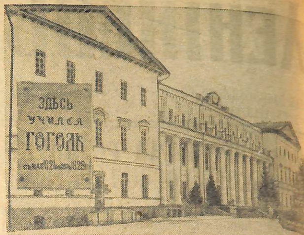
На знімку: будинок Ніжинського державного педагогічного інституту ім. Гоголя. З травня 1821 р. по червень 1828 р. тут, в гімназії вищих наук, учився М. В. ГОГОЛЬ.

Вирішили збудувати лазню і в артілі імені Ворошилова. Навозили каменю для стін і на цьому роботу припинили. Тепер камінь використали на інші потреби.