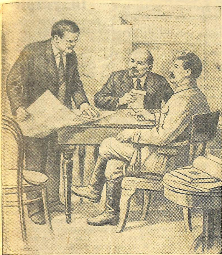
В. І. Ленін, Й. В. Сталін і В. М. Молотов в редакції «Правди» у 1917 році.