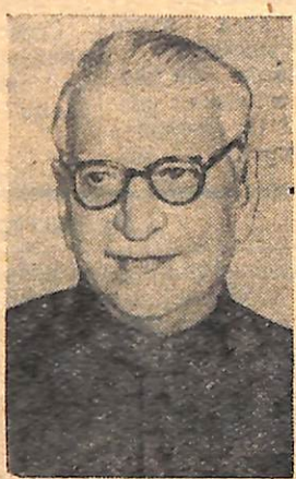
Сайфуддін Кітчлу— голова Всеіндійської Ради Миру.