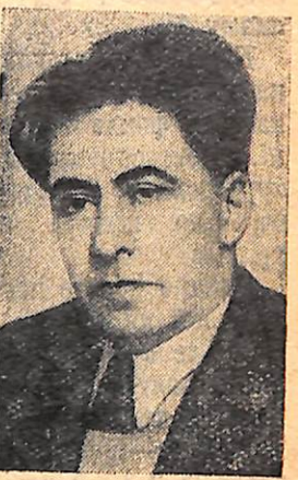
Ілля Еренбург— письменник.