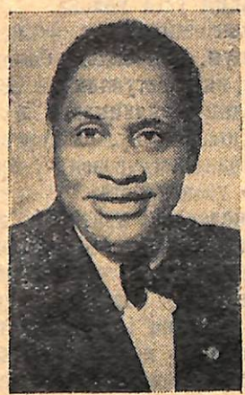
Поль Робсон— відомий співак і громадський діяч, США.