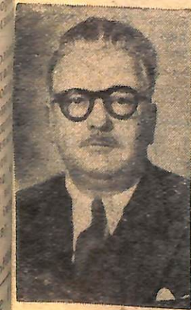
Ів Фарж— громадський діяч, Франція.