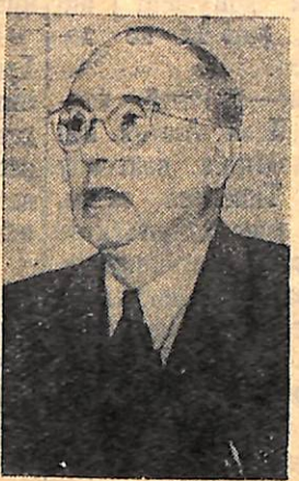
Йоганнес Бехер— поет, Німецька Демократична Республіка.