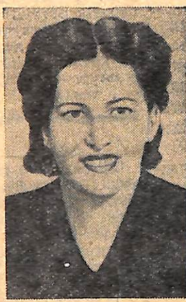
Еліза Бранко— діячка Федерації бразильських жінок.