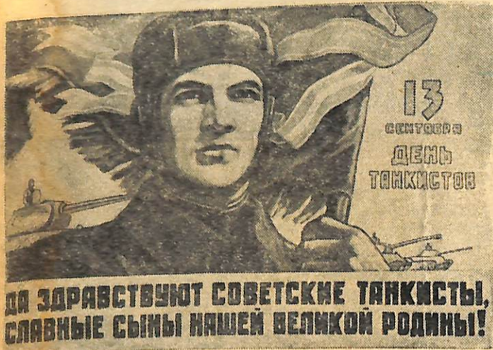
Плакат роботи художника Є. Малолеткова, випущений Державним видавництвом образотворчого мистецтва. („ИЗОГИЗ“).

№ 72 (3346) Неділя, 13 вересня 1953 р. Ціна 10 коп.