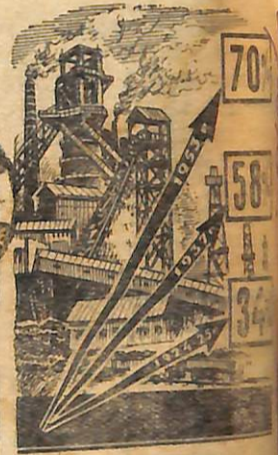
Частина засобів виробництва в продукції всієї промисловості СРСР.

За роки, що минули від XIV з'їзду партії, наша країна добилася великих успіхів в розвитку важкої індустрії. 1924/25 господарському році Радянському Союзу випалося лише 1,8 млн. тонн сталі, вугілля, вироблялося 3 млрд. кіловат-годин електричної енергії. За двадцять вісім років випуск промислової продукції зріс в 29 раз. Тепер у 1924/25 господарському році сталі — в 21 раз, вугілля — в 11 раз, електроенергії — в 45 раз.