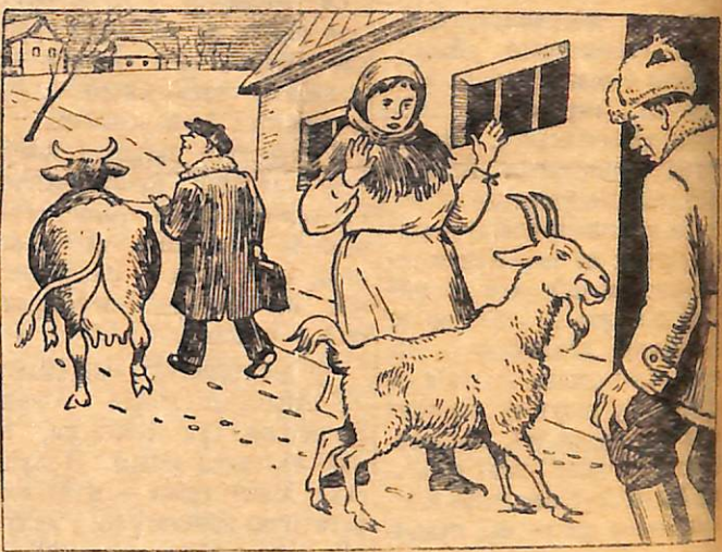
—Тепер корова я, не цап, В корову я перевернувся! (ПРЕСКЛІШЕ РАТАУ).