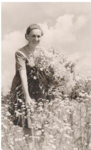
Москва, 1951 г. МГБИ (3 курс)