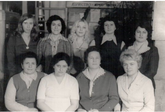
Отдел обработки 60-70-х годов

60-е – 70-е годы в деятельности отдела были посвящены дальнейшему совершенствованию процессов обработки и каталогизации новых поступлений. Особое внимание уделялось расширению и углублению системы центральных каталогов библиотеки. Так, было принято решение дополнить