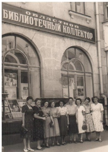
Май, 1953 г.