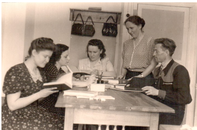
Із студентами-практикантами ХДБІ (3 курс), 1953 р.