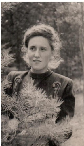
Москва, 1950 г. МГБИ (2 курс)