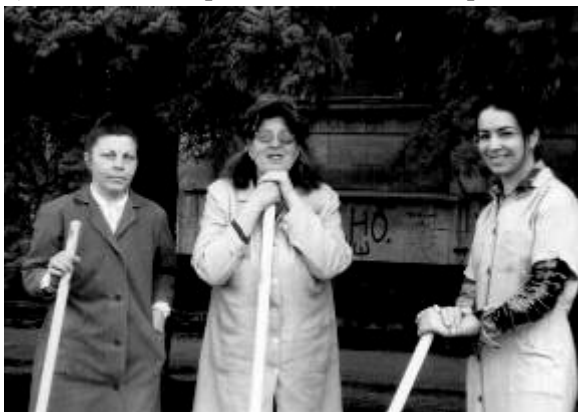
Руководящий состав коллектива отдела книгохранения

Вооружившись необходимым инвентарем (лопатами, ведрами, вениками, корзинами и др.), который, кстати,