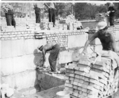
Фотоиллюстрации первых этапов строительства