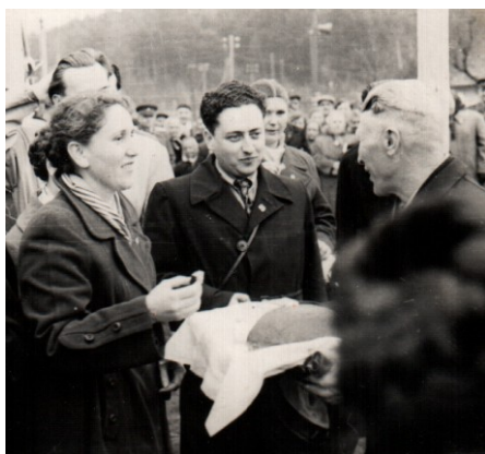
Чехословакия, 1958 г.