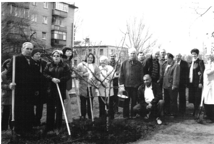
Субботник на территории библиотеки