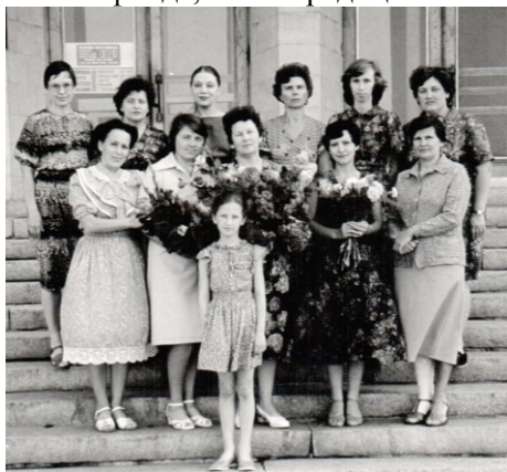
Отдел обработки 80-е годы

В 2004 году в активную фазу существования вступил самый молодой каталог ОУНБ – электронный (до этого момента работа по его созданию велась эпизодически со середины 90-х), создаваемый на платформе программного комплекса «УФД\Библиотека». Молодость не мешает ему постепенно превращаться в основной поисковый инструмент библиотеки, поскольку объединяет в себе алфавитный, предметный и систематический. Электронный каталог имеет много преимуществ – это однократный ввод и многократное использование