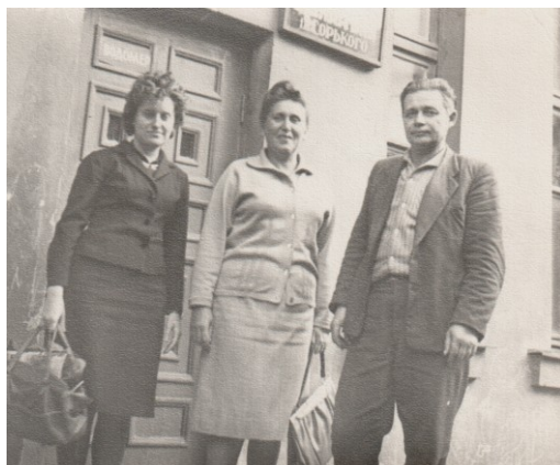
Запорожье, 25.09.1966 г.